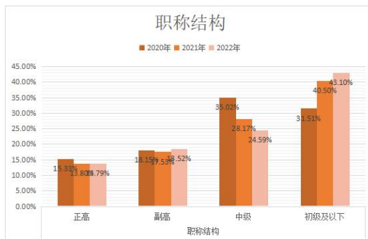
图 1：近三年职称结构变化

(3) 职称提升。激励青年教师尽快提高科研能力、实践能力和教学能力，鼓励提前晋升职称。2021 年，学校共有 35 人晋升职称，其中正教授 4 人，副教授 20 人，高级实验师 1 人，讲师 7 人，实验师 2 人，助教 1 人。