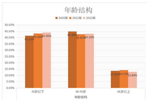
图 3: 近三年年龄结构变化